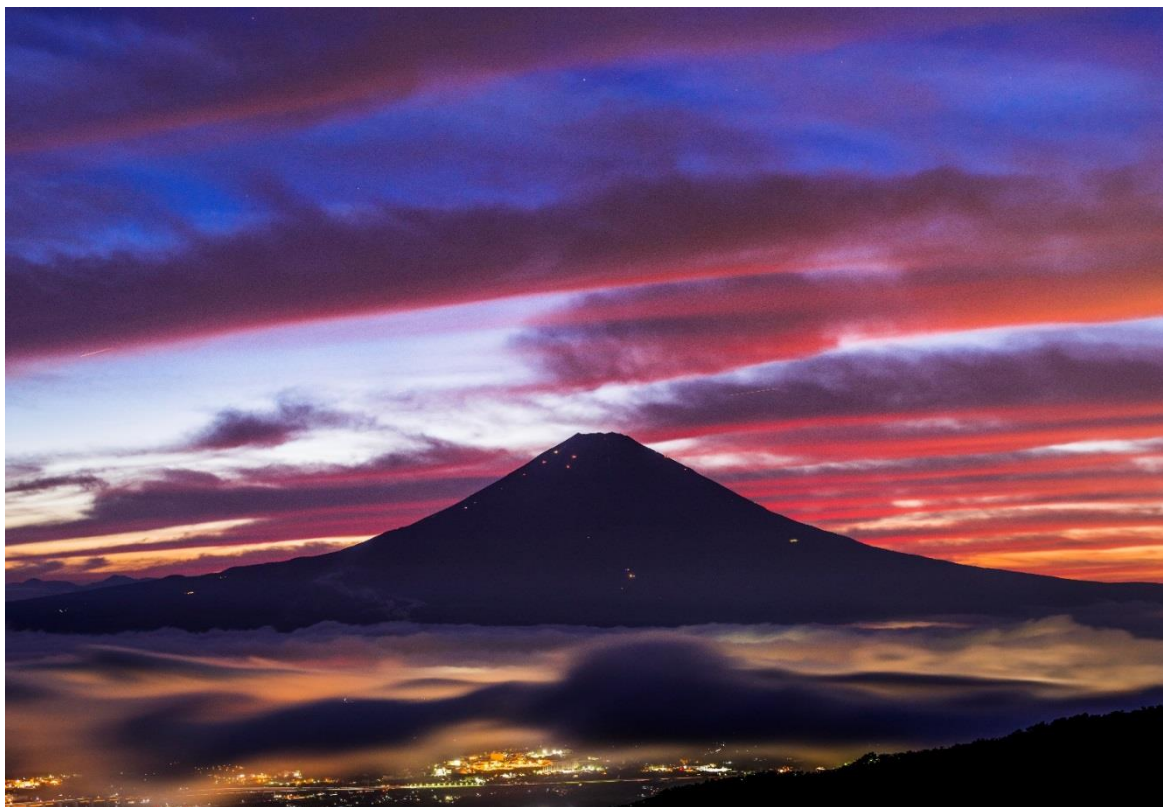
作品名「夏の夕暮れ」（撮影地：静岡県御殿場市） 撮影者 飯田 龍治さん（静岡県御殿場市）