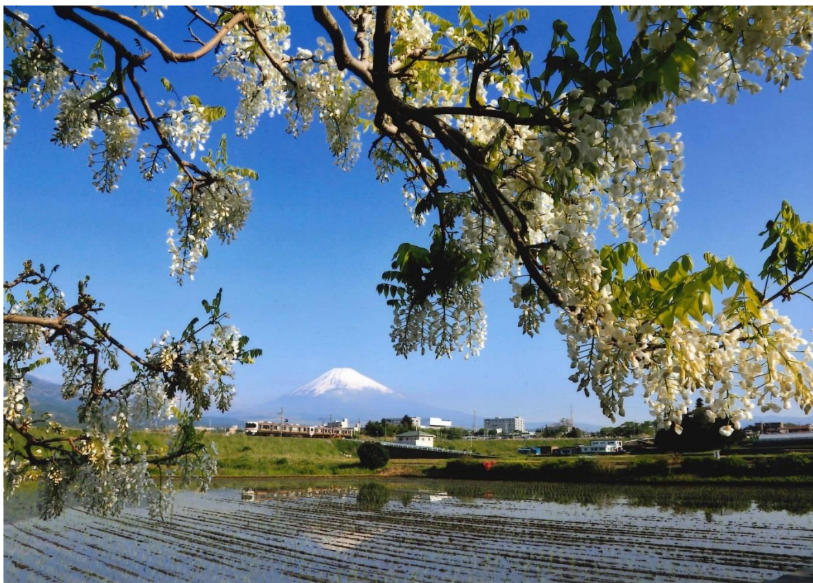
作品名「春の景観」（撮影地：静岡県裾野市） 撮影者 鈴木 常雄さん（静岡県裾野市）