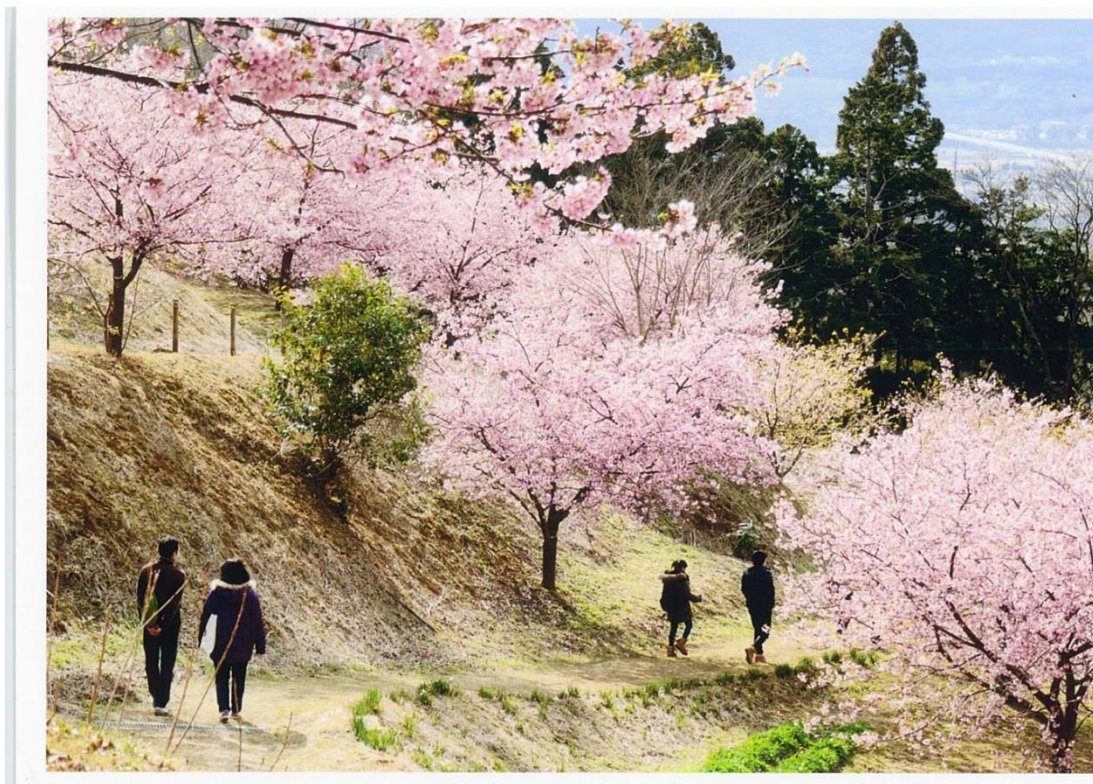
作品名「おおいゆめの里」