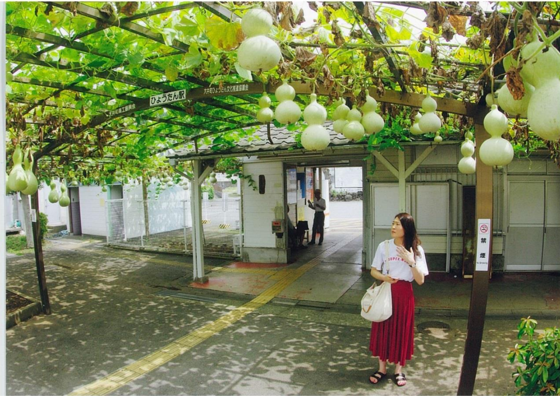
作品名「盛夏」